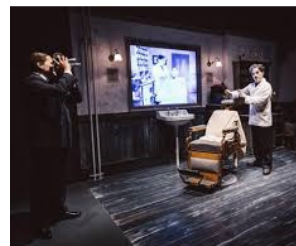
Charlie Chaplin Museum